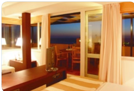
Tengerre néző szobák árait a www.AriadneTravel.com oldalon találhatja.